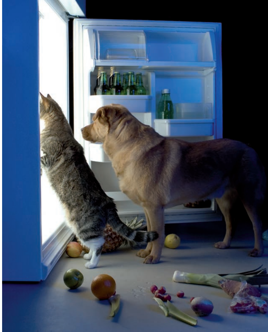
Futter ist eine häufige Ursache für Allergien

bei unseren Haustieren kommt. Vermutlich sind die Ursachen die gleichen wie bei Menschen und damit nicht eindeutig zu benennen. Das Immunsystem reagiert auf einen eigentlich harmlosen Stoff, meistens ein Protein, mit einer massiven Reaktion.