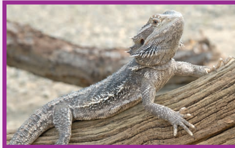
Immer mehr exotische Haustiere kommen ins Tierheim

Pfingst-Sturm davongetragen. So auch in Oekoven. Durch einen alten Kirschbaum wurden Zwinger und Stromleitungen durchschlagen. Auch am Kleintierhaus entstanden durch das Unwetter Schäden, und viele Zäune müssen nun repariert werden. Ob alle Schäden von der Versicherung abgedeckt werden, bleibt abzuwarten. ■