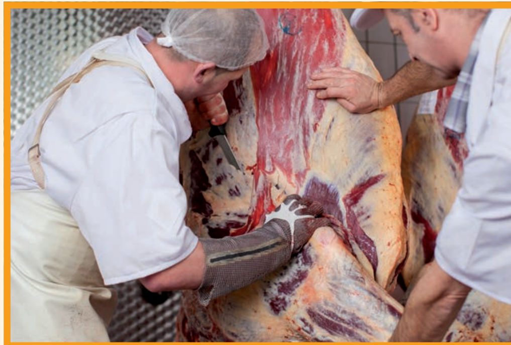
Schlachten im Akkord – keine Zeit für Tierschutz

Im Zweifel hilft dabei als Motivation sicher auch ein YouTube-Video, Suchwort: Schlachthof! ■