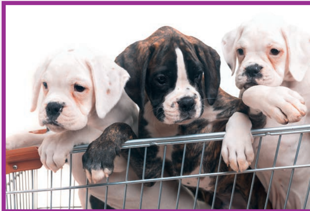
Der illegale Handel mit Welpen boomt

beschlagnahmte Welpen aufnehmen, können die enormen Kosten für Unterbringung und Versorgung kaum tragen. Eigentlich muss die beschlagnahmende Behörde für die Unterbringung aufkommen.