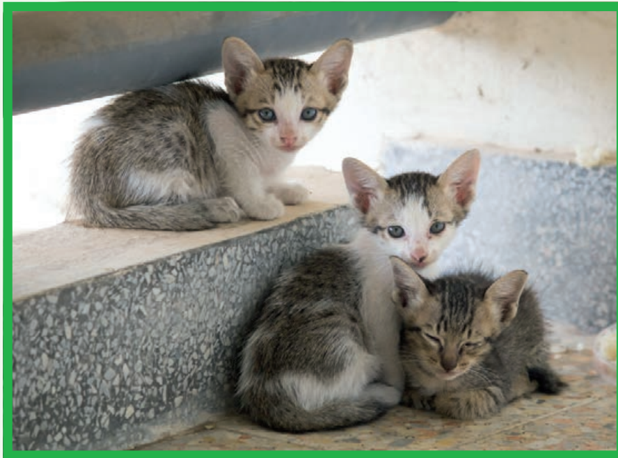
Katzenkastration verhindert auch solche Anblicke – streunende kleine Katzen

Auch im Tierheim Dormagen finden sich täglich traurige Schicksale ein. Heute ist es die ausgesetzte Katzenmutter mit ihren vier Babys und am nächsten Tag Fundhund „Maxe“, der zwar durch einen Mikrochip gekennzeichnet wurde, aber in keiner Tierdatenbank zu finden ist. Damit solche Fälle zukünftig vermieden werden, ist der Tierschutzverein an vielen Fronten aktiv.