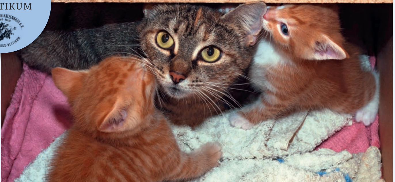
Ein Karton voll Katzen ausgesetzt vor dem Tierheim. Das darf nicht sein!