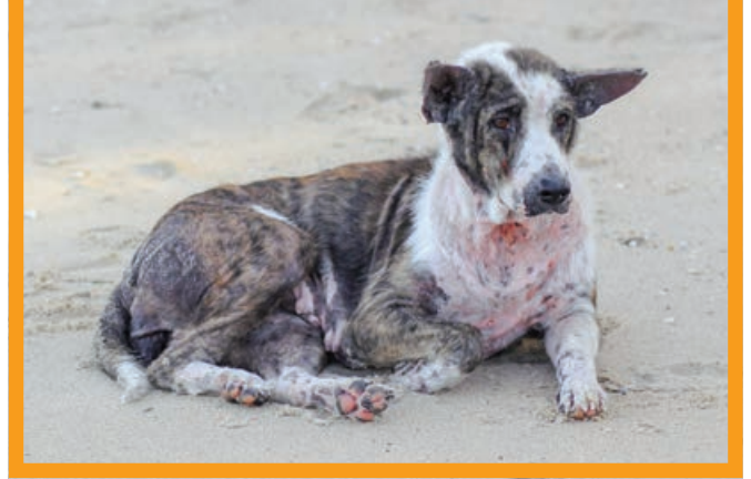
Hund mit allergischer Reaktion auf Flohbisse

defleisch oder andere eher exotische Fleischsorten, wie Känguru. Dieses Futtermittel wird über 3 Monate gegeben. Danach kann man, wenn es zu keinen weiteren Symptomen für eine Allergie kam, andere Sorten ausprobieren und so feststellen, auf welches das Tier wieder mit den vorher gezeigten Krankheitszeichen reagiert.