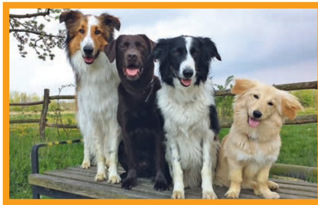
Wer soll es denn sein?

Weg ist der an der Ladentheke. Essen Sie weniger Fleisch und kaufen Sie es dort, wo Sie sicher sein können, dass es den Tieren zu Lebzeiten gut erging und der Tod kurz und schmerzlos war.