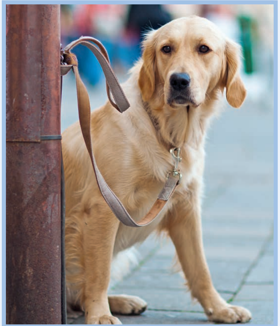
Ausgesetzt zu werden hat kein Haustier verdient

Im Tierheim Bettikum werden fast täglich gefundene Tiere abgegeben. Manche sind ihrem Besitzer abgehauen und werden bald von diesem gesucht und im Tierheim wieder abgeholt. Andere hingegen werden ausgesetzt und nach ihnen sucht kein ehemaliger Besitzer mehr. Ob nun ausgebüxt oder ausge-