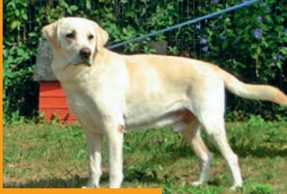
Marco und Benny

Marco und Benny . Marco (ca. 6 Jahre) und Benny (ca. 5 Jahre) sind zwei sehr menschenbezogene und verspielte Labradorrüden. Beide sind seit einem Jahr im Tierheim, dürfen aber erst jetzt vermittelt werden, da sie vom Veterinäramt sichergestellt wurden. Sie sind verträglich mit anderen Hunden und kommen im Tierheim auch mit Katzen zurecht. Kinder sind kein Problem, sie sollten allerdings nicht im Krabbelalter sein. Am liebsten würde das Duo gemeinsam in ein neues Zuhause ziehen, eine getrennte Vermittlung ist aber auch möglich.