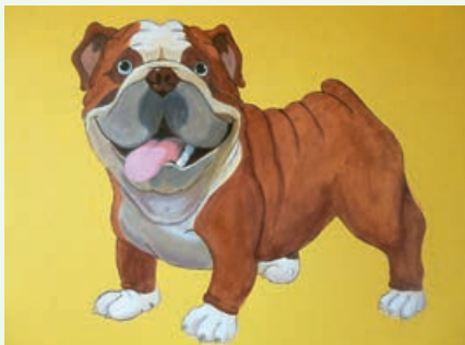
Diese und andere Motive verschönern das Tierheim