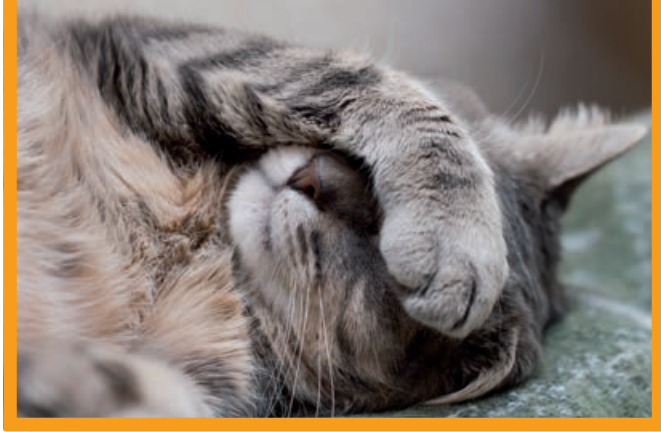
Fühlt die Katze sich nicht wohl, kann auch eine Allergie dafür verantwortlich sein